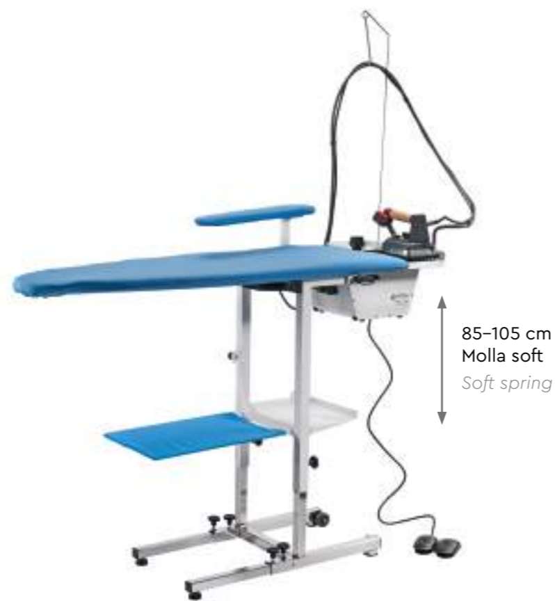
Piano di serie Standard board